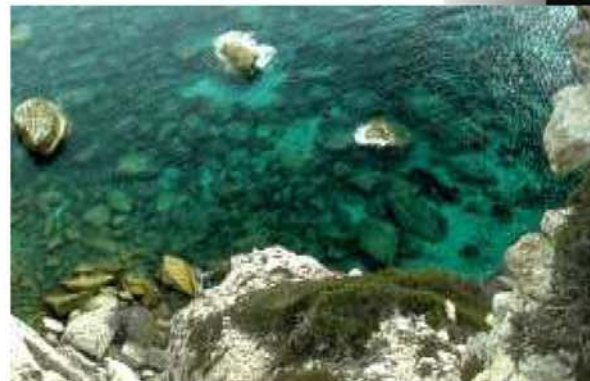
Bonifacio's senkrecht abfallende Klippen

Insgesamt war dieses kontrastreiche Abenteuer gleichermaßen Genuss durch die prägnanten Landschaften und die tollen Fahreindrücke, die wir sammeln konnten.