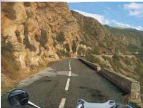
Eng & verwinkelt: Die Westküste Korsikas

läufige grüne Wälder und Berge mit über 2700 Metern Höhe im Landesinneren, sowie bizarre Felslandschaften zu erkunden. Es wurde niemals monoton oder langweilig. Der Drang, wieder etwas neues entdecken zu wollen, gepaart mit unbändigem Fahrspaß trieb uns weiter und weiter... Von Tag zu Tag wurde der von uns gefahrene nagelneue Common-Rail-Diesel-Motor immer giftiger und freier.