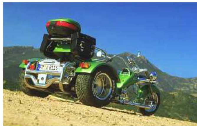
Kurvenwunder TRIKEtec C2

Es ist schlicht und ergreifend überwältigend, hier entlang zu fahren. Wir nutzten eine Felsenbucht am nördlichsten Punkt Korsikas, um im Meer baden zu gehen. Als die von uns zuerst befahrene, neu ausgebaute Straße schlechter wurde, hielten wir kurz an und nutzten die Ressourcen unseres C2 Roadsters um die Luftkammerfederung , die zwar eh schon souverän federt & dämpft, nochmals zu optimieren, so dass auch das letzte Schlagloch durch die Gabel herausgefiltert wurde. Und das tat sie! Während fühler die Trapez-Gabel unseres alten Trikes von Straßenunebenheit zu Straßenunebenheit tölpelte, und sehr ermüdend und kraftaufwendig zu fahren war, schwebte das Fahrzeug mit der