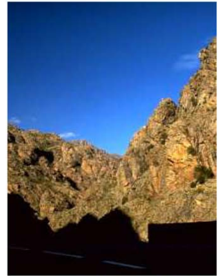
Korsikas wilde Schluchten & Täler

Es ist schlicht und ergreifend überwältigend, hier entlang zu fahren. Wir nutzten eine Felsenbucht am nördlichsten Punkt Korsikas, um im Meer baden zu gehen. Als die von uns zuerst befahrene, neu ausgebaute Straße schlechter wurde, hielten wir kurz an und nutzten die Ressourcen unseres C2 Roadsters um die Luftkammerfederung , die zwar eh schon souverän federt & dämpft, nochmals zu optimieren, so dass auch das letzte Schlagloch durch die Gabel herausgefiltert wurde. Und das tat sie! Während fühler die Trapez-Gabel unseres alten Trikes von Straßenunebenheit zu Straßenunebenheit tölpelte, und sehr ermüdend und kraftaufwendig zu fahren war, schwebte das Fahrzeug mit der