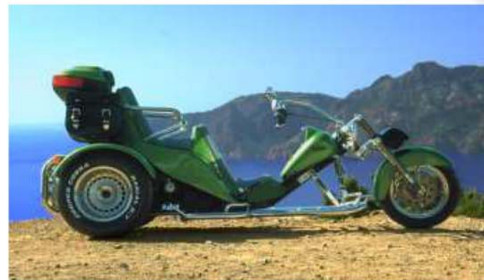
Ein Erlebnis: Mit dem C2-Roadster auf Korsika

läufige grüne Wälder und Berge mit über 2700 Metern Höhe im Landesinneren, sowie bizarre Felslandschaften zu erkunden. Es wurde niemals monoton oder langweilig. Der Drang, wieder etwas neues entdecken zu wollen, gepaart mit unbändigem Fahrspaß trieb uns weiter und weiter... Von Tag zu Tag wurde der von uns gefahrene nagelneue Common-Rail-Diesel-Motor immer giftiger und freier.