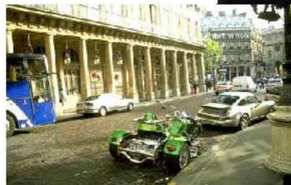
Mit dem C2 hinter dem Louvre, mitten in Paris

Der 3-Rad-Roadster von TRIKETec erwies sich für uns als ausgereift und nicht nur als wochenend-, sondern auch als alltags- & langstreckentauglich. Wir erlebten unvergessliche und unbezahlbare Momente mit unserem grünen Traumfahrzeug.