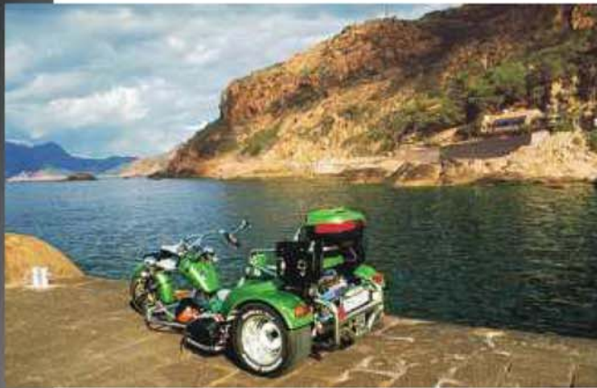
Natur & Hightech: Unser C2 im Hafen Portos

An der Ostküste war Porto , eine alte Piratensiedlung, direkt in einer