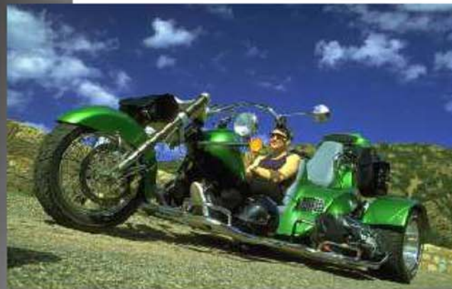
Dem Sommer entgegen...

R1-Gabel" förmlich über die oft katastrophalen Straßenbeläge. Nachdem wir das Cap Corse mit seiner überwältigenden Natur-