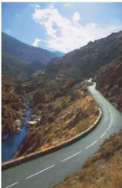
Das Kurvenparadies: KORSIKA

Zum Fährhafen ging es durch die Schweiz, über den Gotthardpass nach